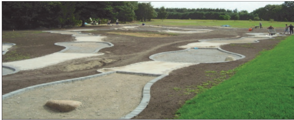
Der Parkplatz ist bereits fertig, hier befindet sich die Minigolfanlage noch im Bau. Blockhäuser für die Jugendlichen und Radtouristen werden in Kürze entstehen.

Die Bauarbeiten sind inzwischen weit fortgeschritten, der Parkplatz ist fertig und die Minigolfbahn ist hier schon deutlich zu erkennen und ist seit dem 15. August in Betrieb