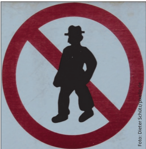
Soll in Dallgow kein Thema mehr sein: Unerwünschte Senioren

Der Beschlussvorschlag, der durch den Bürgermeister eingebracht wurde, sprach von einem möglichen Aufnahmealter von mindestens fünfzig Jahren. Das war auch dem Umstand geschuldet, dass ein potentiell Mitglied des zukünftigen Beirates die sonst übliche Altersgrenze von fünfundfünfzig Jah-