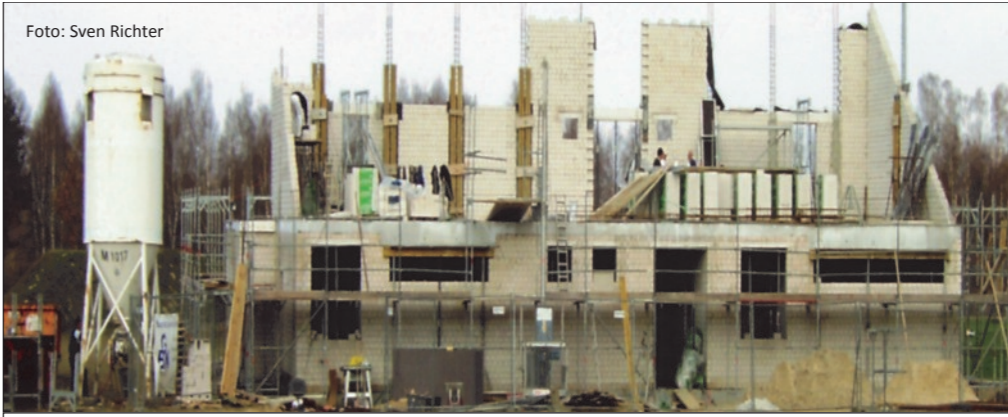
Die Millionendusche im Frühjahr: Die Vergabe für den Rohbau über 220.000€ war einer der skandalösesten Vorfälle von denen Hemberger nichts gewusst haben will, trotz seiner eigenen Unterschrift.

Was ist eigentlich passiert? Der Sonderausschuss, der die Kostenexplosion beim Bau