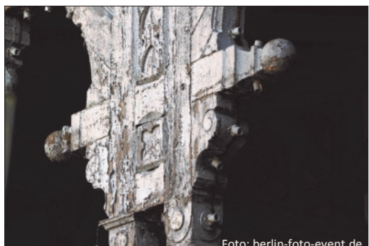
Glanz aus alten Tagen - ein Detail der über 100 Jahre alten Holzverkleidung an der Veranda

Wie viel ist uns das Casino wert? Darüber streiten sich die Gemeindevertreter seit Jahren. Dabei ist es geradezu dumm, diese Diskussion zu führen. Denn die Kosten sind eher zweitrangig. Viel wichtiger ist: Das Casino ist für Dallgow etwas Ähnliches wie das Brandenburger Tor für Berlin. Da fragt keiner nach, wie hoch die Sanierungskosten für das Denkmal sein dürfen. Denn allen ist die Be-